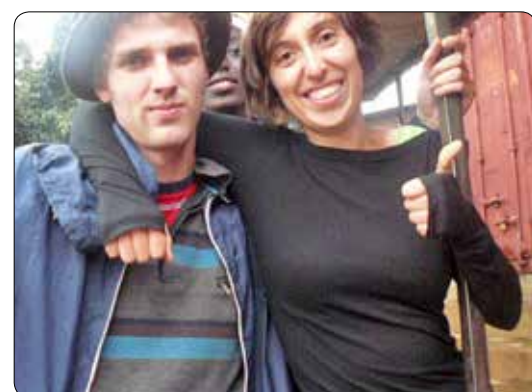
Op missie in Rwanda 2008