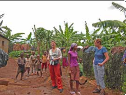
Bezoek aan Rwanda 2013