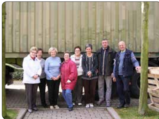
Container voor Rwanda 2008