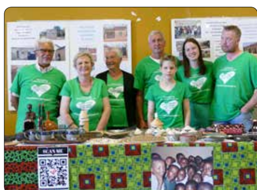
Afrikaans feest 2022