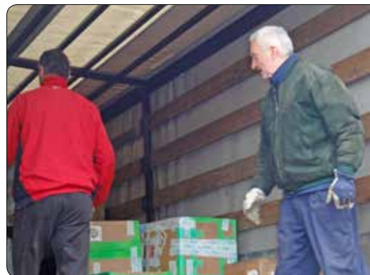
Zending voor Rwanda 2013