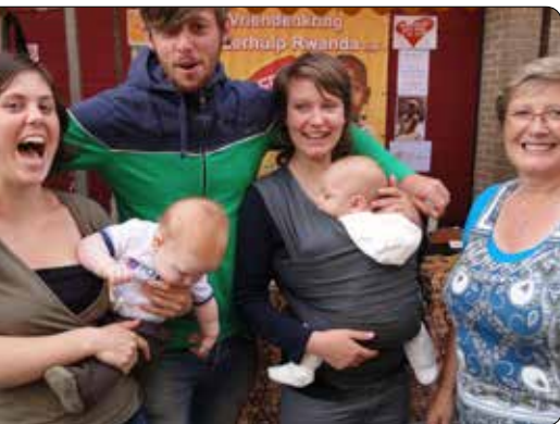
Casa del Mundo 2012