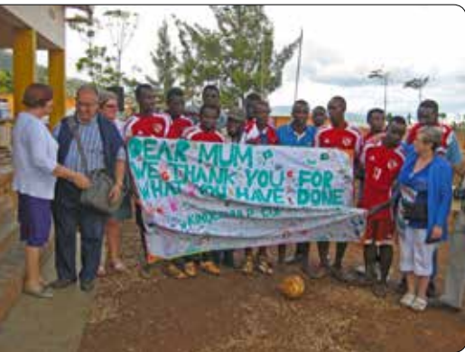
Afscheidsfeest CMG 2014