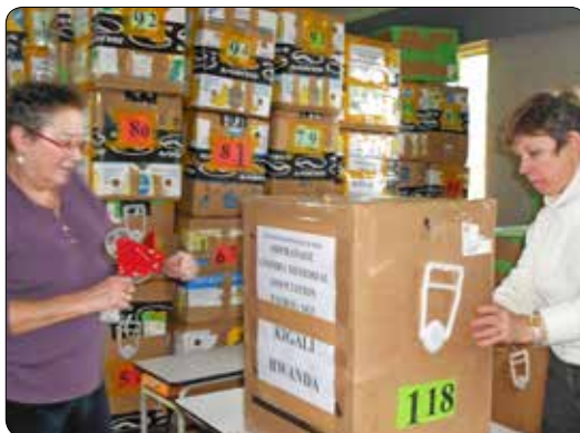
Zending voor Rwanda 2013