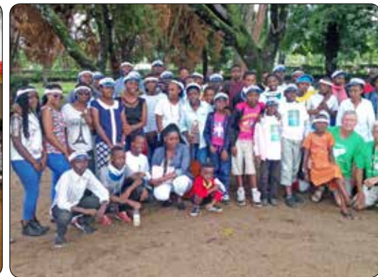
Op uitstap met de kinderen 2017