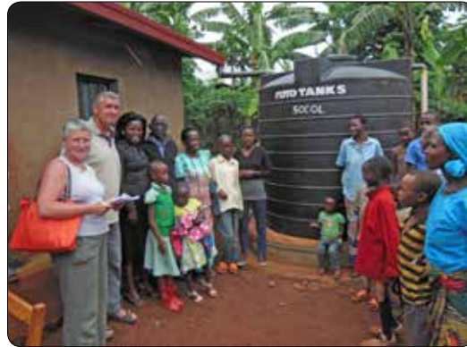
Bezoek aan Rwanda 2013