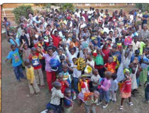
Bezoek aan Rwanda 2009