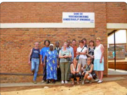
Bezoek aan Rwanda 2006

Op de volgende bladzijden willen we een ode brengen aan al onze vrijwilligers die gedurende vele jaren de vereniging geholpen hebben bij diverse activiteiten. Bedankt vrijwilligers jullie hebben de vereniging gemaakt tot wat ze nu is.