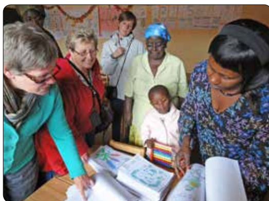
Prospectie in Rwanda 2011