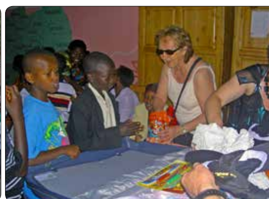
Bezoek aan Rwanda 2009