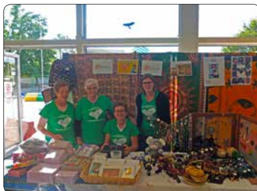
Wereldfeest Deinze 2015