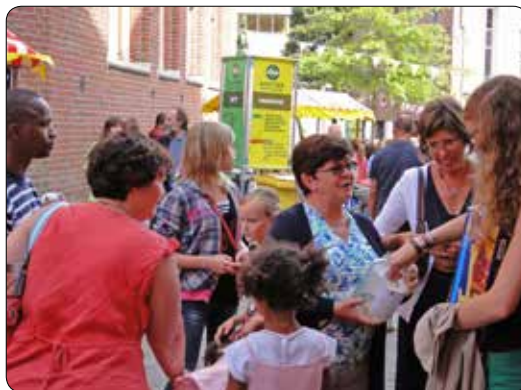
Casa del Mundo 2012