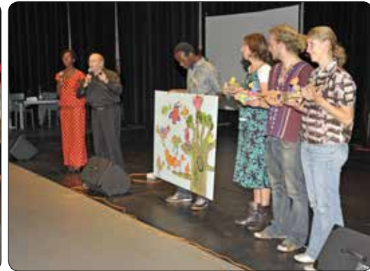
20 jaar VKR 2009