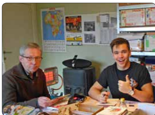
Sociale stage 2013