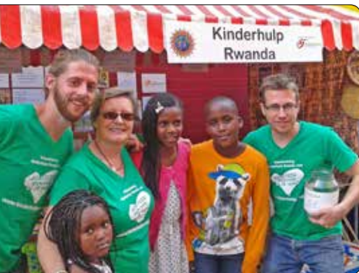
Casa del Mundo 2014