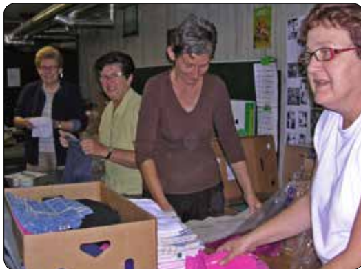
Stockage werking 2008