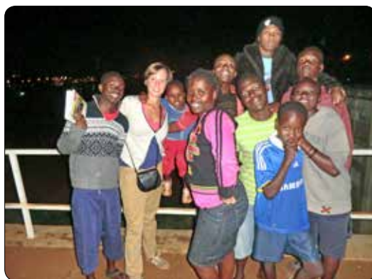
Op missie in Rwanda 2011