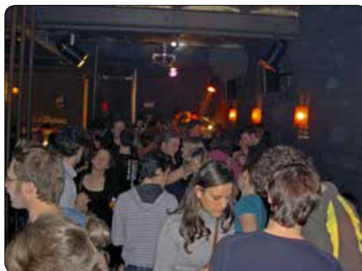
Sawa Sawa 2009