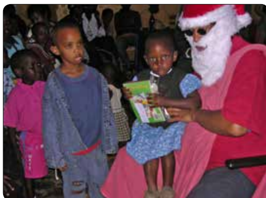
De kerstman kwam mee uit België 2006