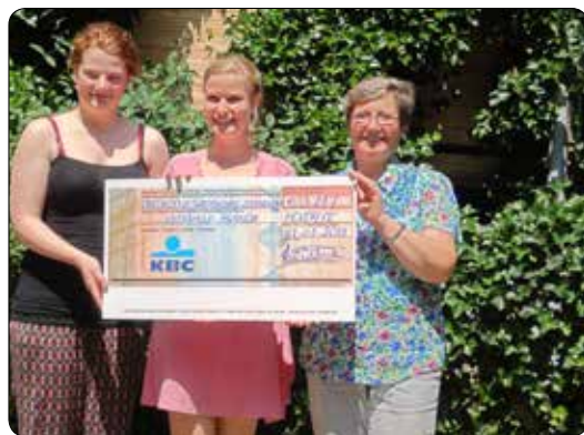
Actie in Houthalen 2013