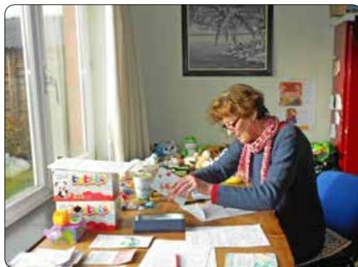
Kerstkaartjes maken 2014