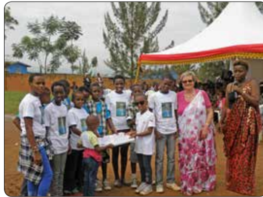
Afscheidsfeest CMG 2014