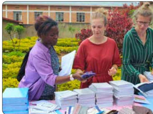
Stage in Rwanda 2019