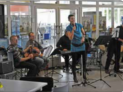
20 jaar VKR 2009