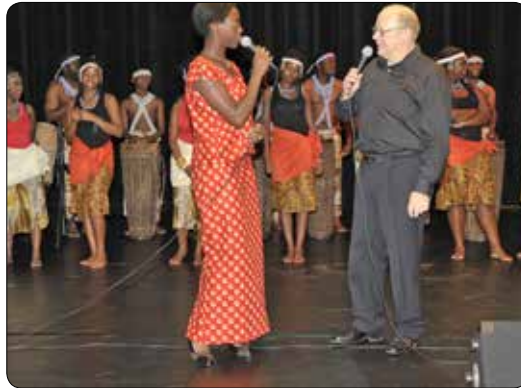
20 jaar VKR 2009