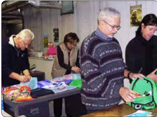
Stockage werking 2008