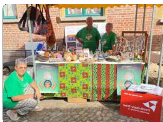
Casa del Mundo 2022