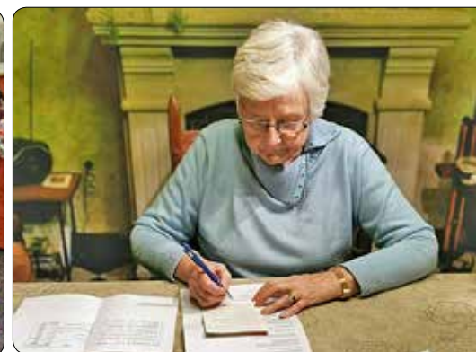
De warmste week 2020