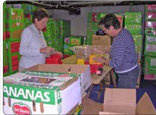
Stockage werking 2008