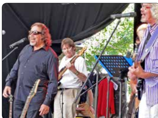
Layabouts 50 jaar 2013