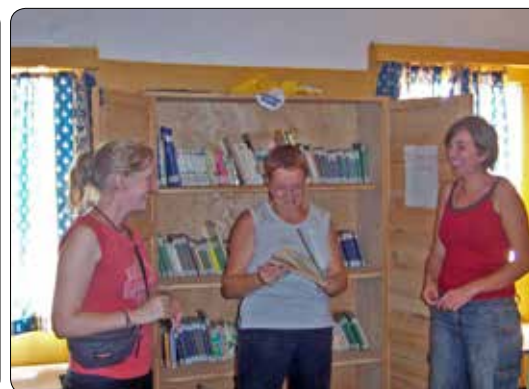
Bezoek aan Rwanda 2007