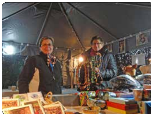
Kerstmarkt jeugd 2013