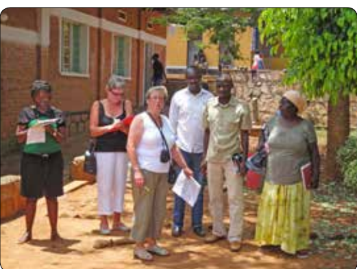
Prospectie in Rwanda 2011