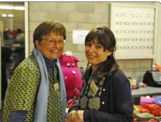
20 jaar VKR 2009