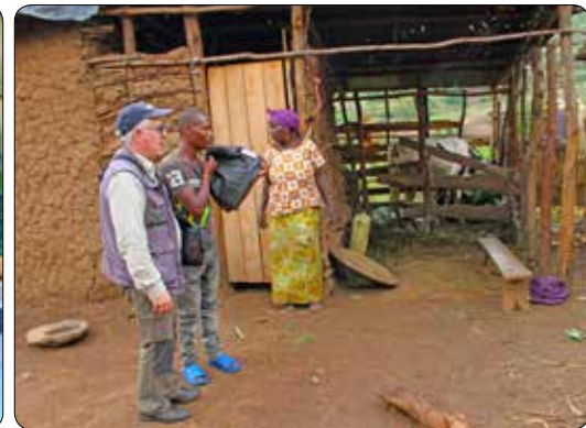
Bezoek aan de gezinnen 2019