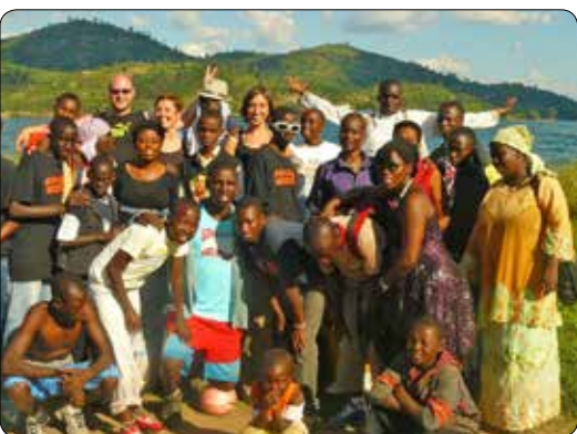
Op missie in Rwanda 2010