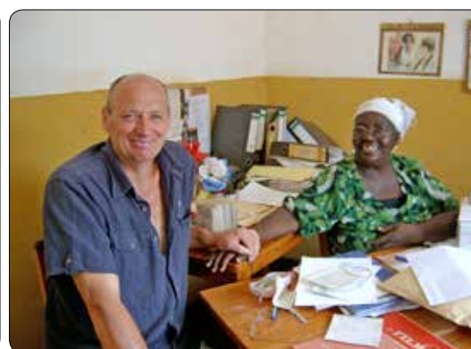
Werking in Rwanda 2012