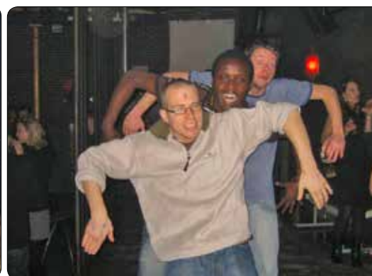
Sawa Sawa 2010