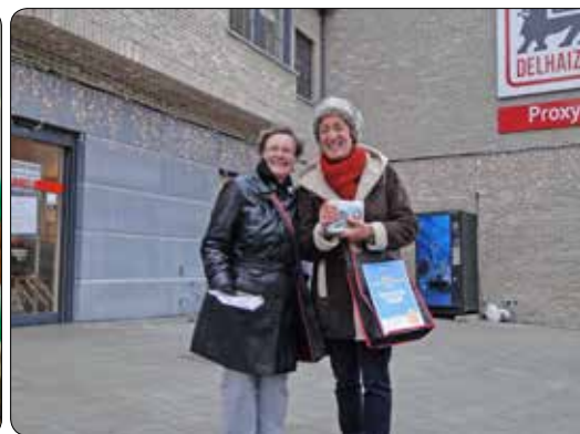
Music for Live 2013