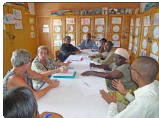
Prospectie in Rwanda 2011