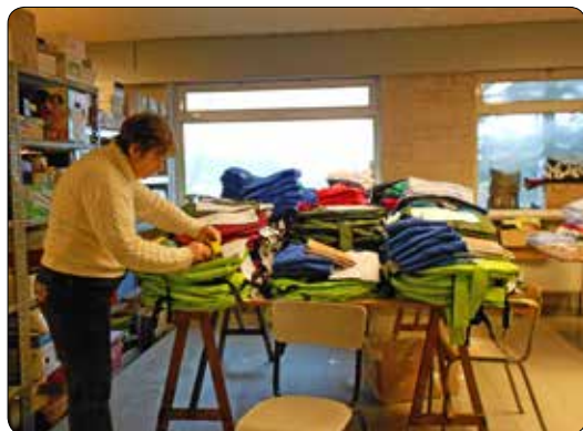
Zending voor Rwanda 2013