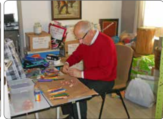
Stockage werking 2014