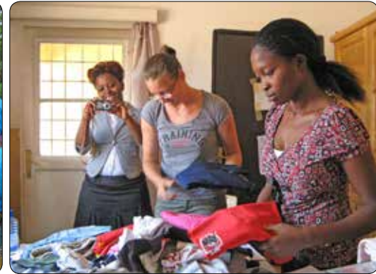
Bezoek aan Rwanda 2013