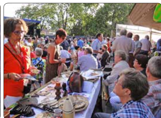
Layabouts 50 jaar 2013