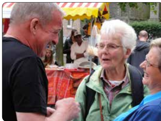
Casa del Mundo 2013