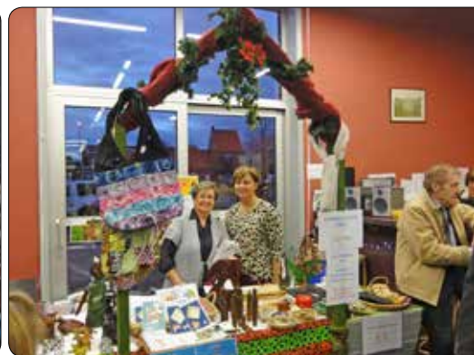
Kerstmarkt Sint Petrus 2013